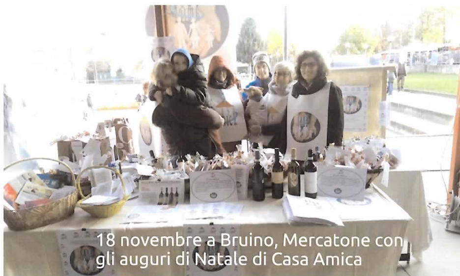
18 novembre a Bruino, Mercatone con gli auguri di Natale di Casa Amica